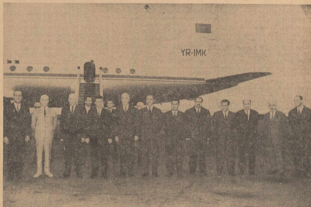
La sosire, pe aeroportul Băneasa.