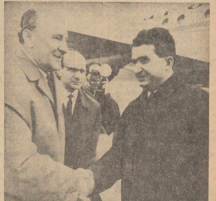
La sosire pe aeroportul Ferihegy din Budapesta