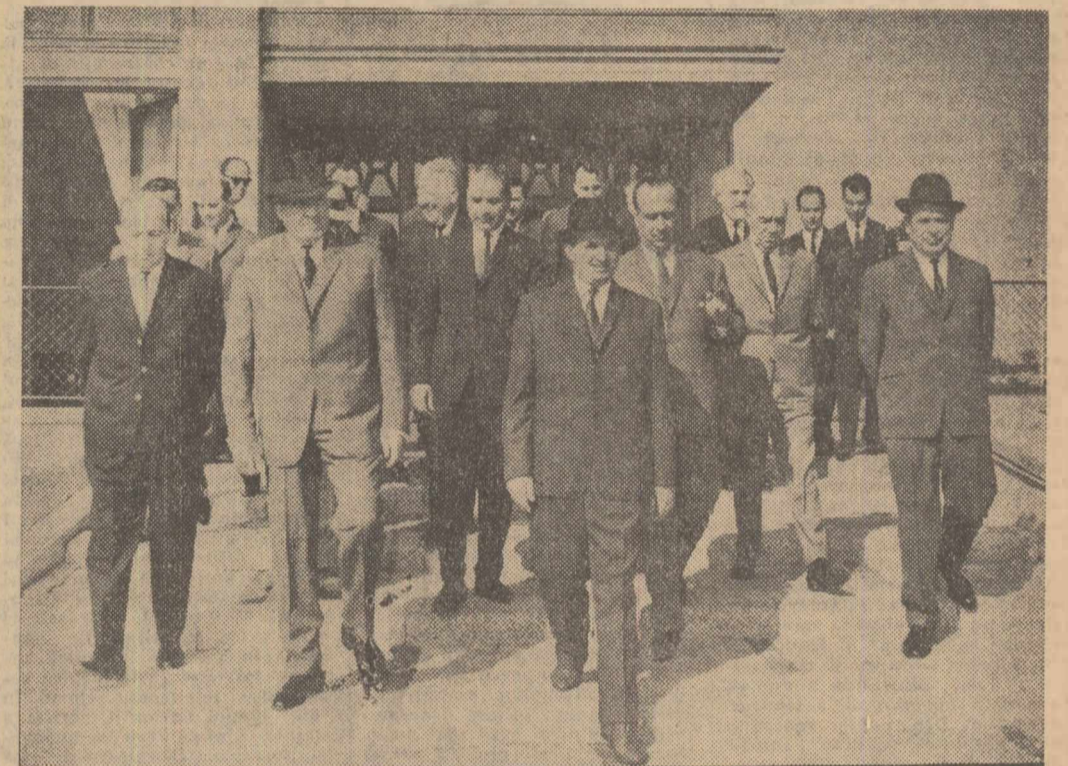
Pe aeroportul Băneasa înainte de plecare

Miercuri dimineața a părăsit Capitala delegația Comitetului Central al Partidului Comunist Român, condusă de tovarășul Nicolae Ceaușescu, secretar general al C.C. al P.C.R., care, la invitația Comitetului Central al Partidului Muncitoresc Socialist Ungar, va face o vizită prietenească la Budapesta.