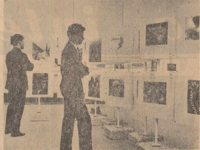
Iubitorii imaginii fotografice vizitează, începînd de ieri, în sala Dalles, cel de-al VI-lea Salon internațional de artă fotografică al Republicii Socialiste România. Fotografii expuse, 800 la număr și 300 diapozitive - alb-negru și color - sînt create de artiști din 53 de țări de pe toate meridianele globului. În clișeu: Aspect din expoziție.