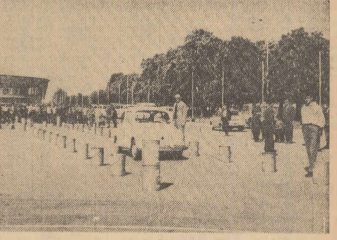
Aspect de la proba de îndeminare care s-a desfășurat ieri dimineață în apropierea Pavilionului Expoziției