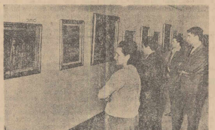
O nouă expoziție retrospectivă consacrată pictorului Dumitru Ghilăș și-a primit ieri primii vizitatori, în galeria Muzeului de Artă al Republicii Socialiste România. În imagine, un aspect de la expoziție

La Combinatul de Industrie Locală din Timișoara a fost terminat ieri un nou tip de garnitură dormitor, realizat în stil balдахin. Noul model va fi trimis și la expoziția de mobiliă de la Leningrad.