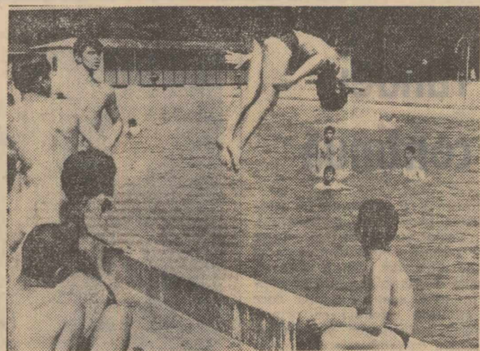
O ilustrată estivală de anul trecut? Dimpotrivă, un instantaneu la zi: în Capitală s-au deschis ieri primele stranduri. Dacă vremea va fi prielnică, la sfîrșitul săptămîinii vom asista la inaugurarea sezonului și la Floreasca, Snagov și Băneasa. Debutul a fost promițător. Numai la strandul „Izvor” s-au înregistrat 200 de vizitatori

În stațiunea balneară Lipova a intrat ieri în funcțiune o nouă linie de imbuteliere a apelor minerale, cu o capacitate de patru milioane litri anual.