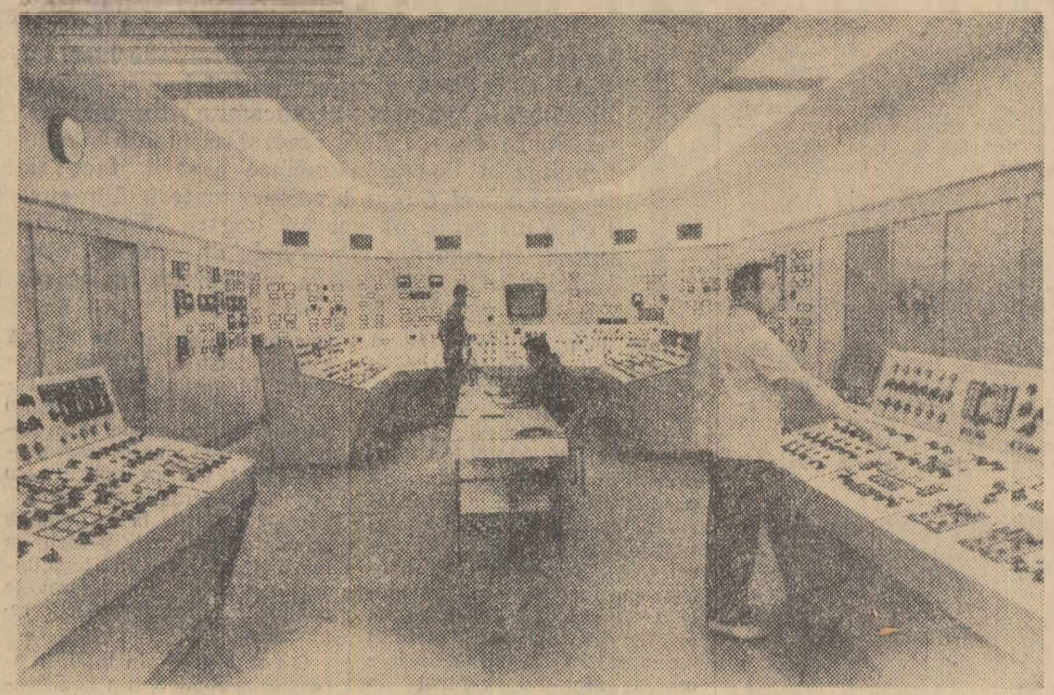
Din camera de comandă, așa-numită termică, este permanent dirijată și urmărită, prin intermediul aparatelor de măsură, buna funcționare a agregatelor grupurilor de 100 Megawați, numărul 3 și 4 de la termocentrala Ludus. În fotografie: o imagine a acestei săli de comandă

Comitetul Central al Partidului Comunist Român și Consiliul de Miniștri al Republicii Socialiste România își exprimă convingerea că măsurile cu privire la folosirea completă și eficientă a timpului de lucru vor contribui la îndeplinirea exemplară a sarcinilor de plan, că toți oamenii muncii vor desfășura o activitate susținută pentru folosirea completă a timpului de lucru și întărirea disciplinei în muncă, dîndu-și întregul aport la îndeplinirea politicii partidului de dezvoltare a economiei naționale și ridicarea bunăstării întregului popor, la propășirea patriei noastre.