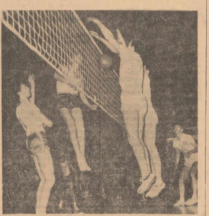
Blocajul dinamovist a fost străpunș...

Manifestarea aceasta constituie prima dintr-o serie mai lungă de întîlniri între tineri actori dramatice și reprezentanți ai presei.