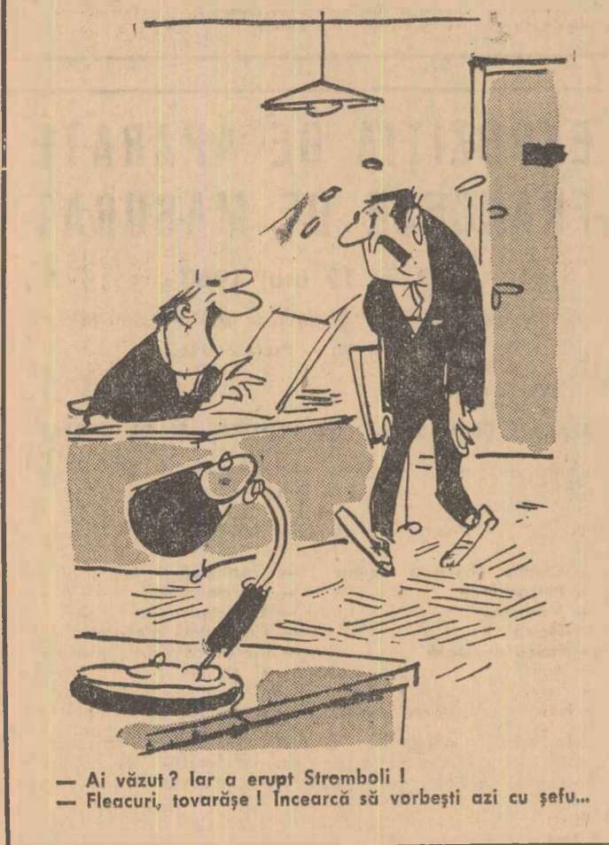
— Ai văzut? Iar a erupt Stromboli! — Fleacuri, tovarășe! Încearcă să vorbești azi cu șefu...