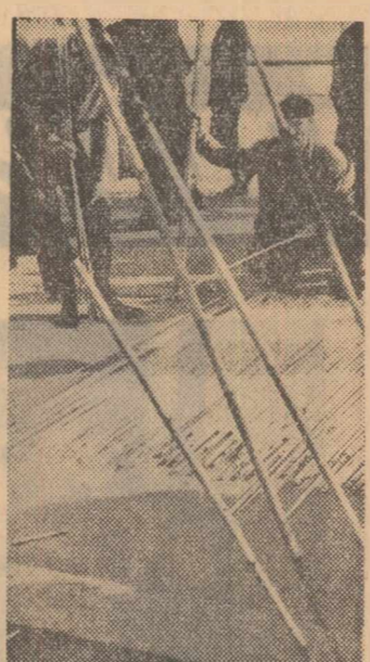
O dată cu noul sezon de pescuit, magazinele cu articole de specialitate și punctele de desfacere din piețe cunosc o mare afliuență de cumpărători. În clișeu: Pescari amatori cumpărînd ieri undițe în piața Obor