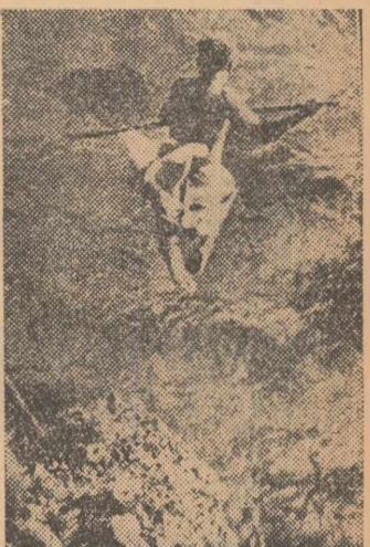
Neophit, iscuzitul vînător de caracatițe în urmărirea „pradei” veniți aici din est, în marile lor pirogi.

În sud-vestul Oceanului Pacific, în apropiere de arhipelagul Noua Caledonie, trăiește un trib de oameni, cu statură atletică, curajoși. Ei se trag din vechii polinezieni,