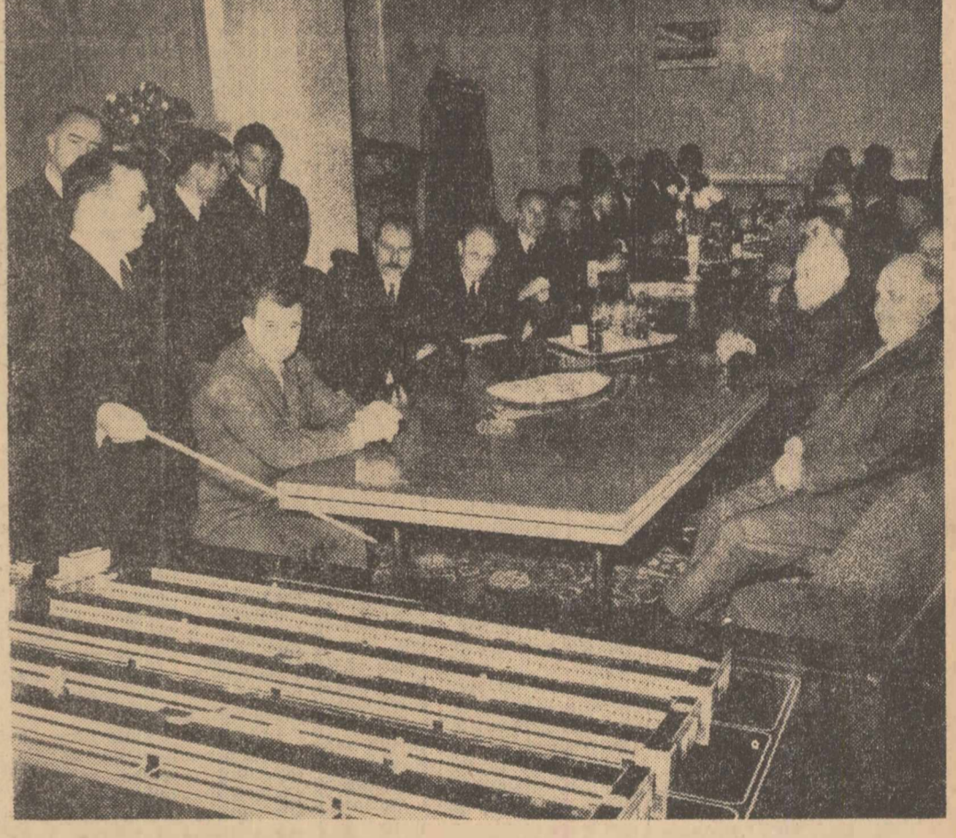
La Uzina de aluminiu din Slatina se prezintă înălților oaspeți macheta întreprinderii.

„Pitești. Din zorii zilei, îmbrăcat în vestimente de sărbătoare, orașul este străbătut de freacămul mulțimii venite pe străzi în ciuda ploii, în întîmpinarea conducătorilor de partid și de stat bulgari și români. La intrarea în oras, pe mari pancarte sînt scrise urările: „Bine ați venit, dragi oaspeți!”, „Salut frățesc poporului bulgar”, „Trăiască unitatea țărilor socialiste!”, „Trăiască unitatea mișcării comuniste și muncitorești internaționale!”. Mii și mii de locuitori, aflați pe străzile orașului aclamă cu entuziasm sosirea conducătorilor de partid și de stat români și bulgari. Se aud ovăzii și urale în cinstea prieteniei de nezdruccinat dintre cele două popoare vecine și prietene, urări de „bun venit” adresate conducătorilor celor două țări și partide, se flutură stegulete și buchete de flori.