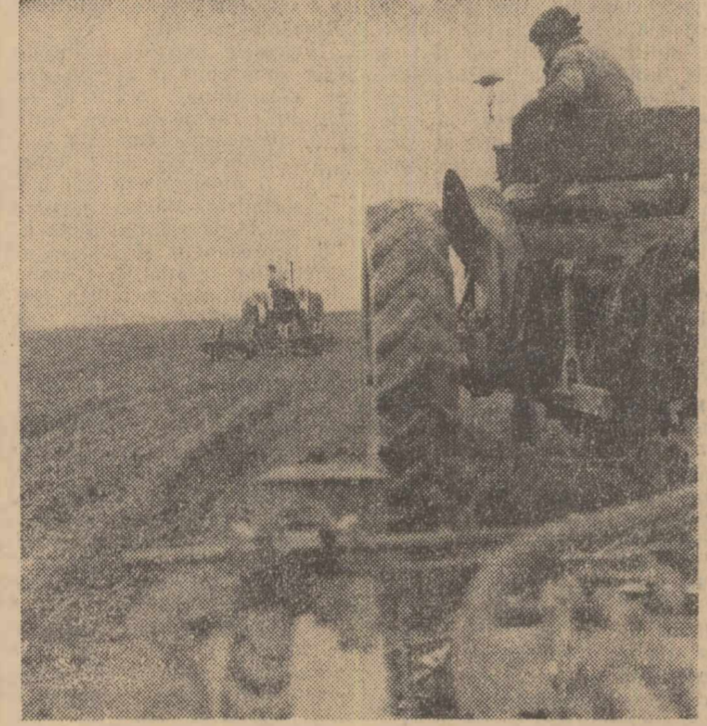
La cooperativa agricolă „Unirea”, din regiunea Galați, mecanizatorii însămînțează ultimele suprafețe prevăzute cu porumb.