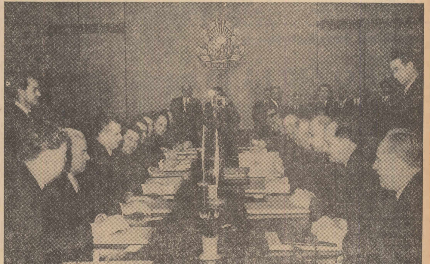
În timpul convorbirilor oficiale

Agenda turistică de sezon mai cuprinde un număr de excursii speciale, prilejuite de unele spectacole, printre care cel al cîntăreții Betty Curtis, meciuri internaționale, dintre care cităm pe cel dintre reprezentativele României și Italiei, în seriile Campionatului mondial.