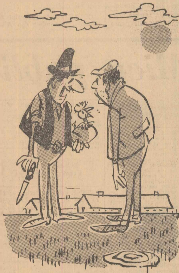
— A căzut cloșcă înainte de termen și n-o dat peste cap toate statisticile...