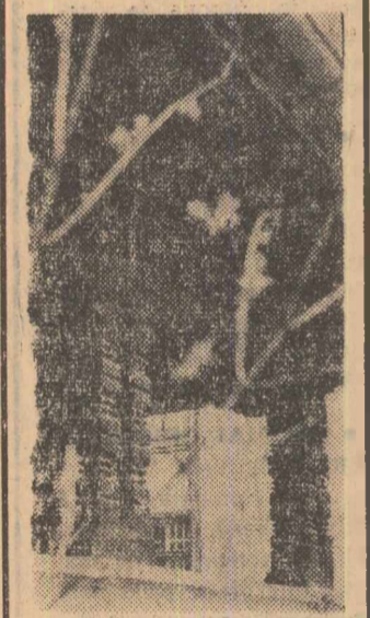
Fotoreporterul nostru a surprins acest frumos balcon, lucrat în maniera tradițională cardiacă românească, la o clădire de pe strada Andrei Mureșanu din Capitală.

S-ar părea că banala sită este cauza rădăcilor. În realitate însă este vorba de neglijența celor care nu iau măsuri de prevenire și în felul acesta aduc prejudicii avutului obștesc.