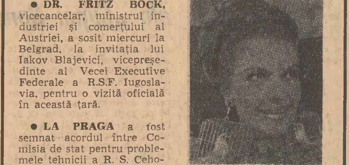
a filmului „Spune-mi-o sub razele soarelui”. Acești cercei sînt alcătuiți din două colivii de aur, în interiorul cărora au fost introduse două pasărele australiene.