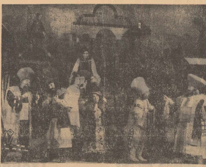
Teatrul de stat din Bacău a prezentat recent în premieră pe tară comedia „Cîntec de inimă alăbrăst” de Marin Iordă. În clișeu: O scenă din spectacol