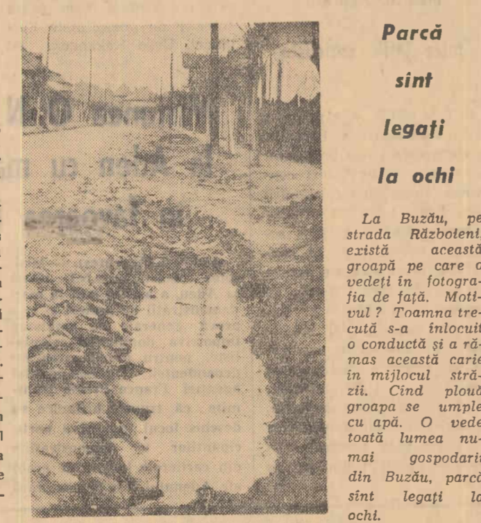
Parcă sint legaji la ochi