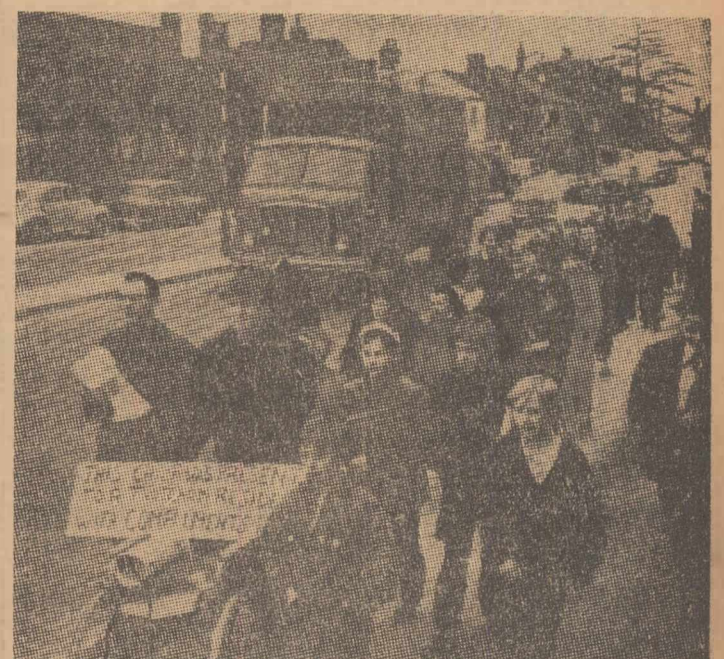
Imaginea a fost luată la o manifestare a locuitorilor satului Thatcham din regiunea Berkshire-Anglia, cerind autorităților să înființeze locuri de traversare pentru pietoni și limitarea vitezei autovehiculelor pe șoseaua care străbate localitatea. Anul trecut, mai multe persoane au fost omorâ-

în caz de boală și bătrânețe, precum și pentru crearea unui sistem eficient de asistență medicală și socială. În încheiere, el a înfățișat experiența țării noastre în problema garantării materiale a drepturilor și libertăților înscrise în Constituția Republicii Socialiste România. În Comisia pentru studiul problemelor culturale a luat cuvântul conf. univ. Constantin Stătescu. El a vorbit despre importanța pe care Marea Adunare Națională și guvernul român o acordă dezvoltării științei și despre eforturile desfășurate în acest domeniu de statul nostru. Vineri, la Palma del Majorca s-au încheiat lucrările comisiei Uniunii interparlamentare, care au pregătit proiectele și documentele pentru cea de-a 56-a conferință a Uniunii, ce va avea loc în septembrie anul acesta la Moscova. În zilele de 1 și 2 aprilie va avea loc cea de-a 100-a sesiune a Consiliului Uniunii interparlamentare.