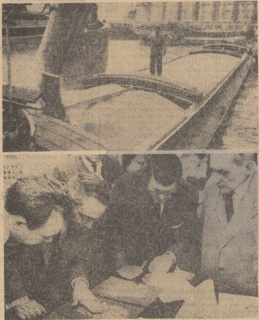
Montarea primei secții cilindrice a mezoscafului „PX-15“, conceput de către inginerul elvețian dr. Jacques Piccard, a început joi la Monthey. Destinat cercetărilor științifice, acest submersibil va fi terminat la sfîrșitul acestui an. Construcția sa, care este finanțată de o societate de aviație americană, costă după calculele actuale, aproape un milion de dolari. Mezoscaful „PX-15“ are o lungime de 14 metri, un diametru de 3,50 metri, și va fi înzestrat cu patru motoare electrice cu curent al-

port, cum ar fi, de pildă, Anvers (fotografia din dreapta), de unde ar fi trebuit să ia calea unor țări din afara Pieței comune. Acest periplu al boabelor era destinat să mascheze exportul fictiv pe baza căruiu „îngururile comunitare“ au încasat primele oferte de Piața comună... pentru a acoperi diferența dintre prețul cerealelor pe piața C.E.E. și cel de pe piața mondială. Astfel, complicatelor mecanisme ale tarifelor comunitare li se joacă renghinuri ilicite, pe lângă cele licite care au consacrat atâtea eșecuri ale integrării.