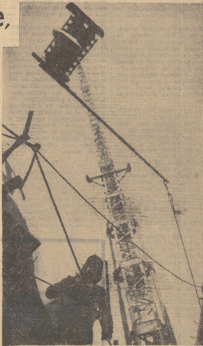
Gigantica macara — adevărată antenă în văzduh — înscris pe fundalul șantierului Combinatului siderurgic de la Galați — curturile viitorului obiectiv — furnalul de 1700 m.c.