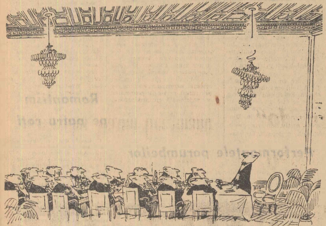
— Domnilor, voi fi scurt!... (Desen de Sempé reproduc după revista italiană L'Europeo)

Abonamentele se primesc la toate oficiile poștale, factorii poștali și difuzorii din întreprinderi și instituții. Tiparul Combinatului Poligrafic Cass Scatelli