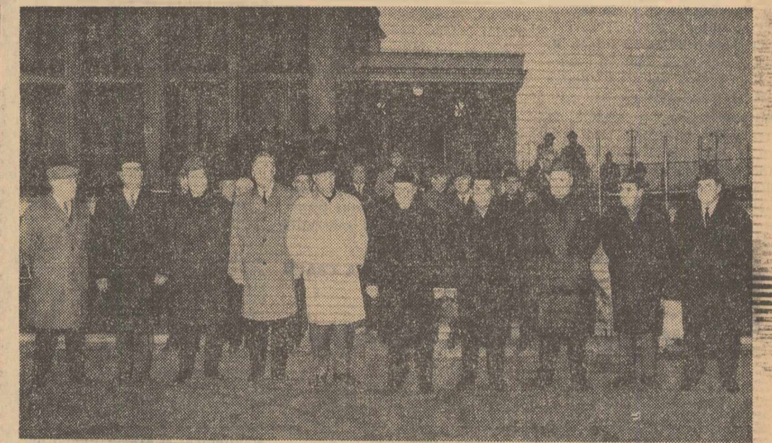
La plecare, pe aeroportul Băneasa

Vineri dimineața, au părăsit Capitala, îndreptîndu-se spre Moscova, tovarășii Nicolae Ceaușescu, secretar general al Comitetului Central al Partidului Comunist Român, Ion Gheorghe Maurer, membru al Comitetului Executiv, al Prezidiului Permanent al C.C. al P.C.R., și al Prezidiului de Miniștri al Republicii