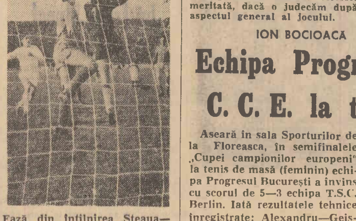
Fază din înțînirea Steaua—Dinamo București

Aseară în sala Sporturilor de la Floreasca, în semifinalele „Cupei campionilor europeni” la tenis de masă (feminin) echipa Progresul București a învins cu scorul de 5—3 echipa T.S.C. Berlin. Iată rezultatele tehnice înregistrate: Alexandru—Geissler 2—0; Babiciuc—Hovestadt 2—0; Crîșan — Benninghaus 2—0; Alexandru — Hovestadt 2—0; Crîșan — Geissler 0—2; Babiciuc — Benninghaus 0—2; Crîșan — Hovestadt 1—2; Alexandru — Benninghaus 2—0. În finală, Progresul va juca cu Sparta Praga.