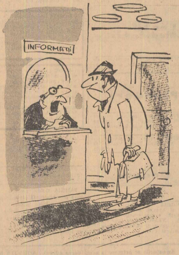
— Dacă ași fi știut de ce nu se țin audiențele planificate aici la ministru, afla tovarășe că nu stăteam la ghișeu! Asta. Eram director general!