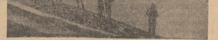
Pasiunea pentru pescuit i-a cuprins și pe cei mari și pe cei mici. Duminică, profitînd de timpul frumos, au pornit-o în corpore pe malul lacurilor din jurul Capitalei. Cliseul nostru vă prezintă un grup de pescari pe malul lacului Herăstrău.

Ieri, agenția O.N.T. din București a reluat excursiile în circuit în orașul București. Acestea vor fi organizate pe teme diverse: monumente istorice și arhitectonice; muzee și case memoriale; locuri legate de istoria mișcării