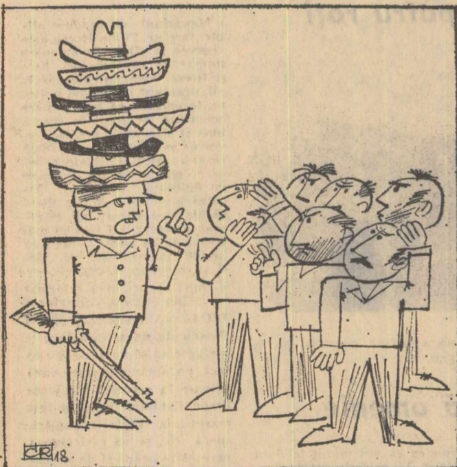
— Nu înțeleg de ce nu vă convine proiectul nostru I... Desen de VLAD CRIVĂȚ

Tot mai multe state sud-americane refuză să sprijine proiectul S.U.A. de creare a forțelor militare interamericane.