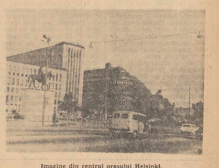
Imagine din centrul orașului Helsinki

WASHINGTON 13 (Agerpres). — Comențind propunerea lui Leslie B. Worthington, președintele Institutului american al fierului și oțelului, vizînd crearea unui tarif vamal compensator asupra importurilor de produse siderurgice, agenția France Presse scrie că ea constituie o nouă ofensivă protectionistă. La Washington se apreciază că această propunere, formulată de Worthington în cursul unei reuniuni la care au participat membri ai Congresului și reprezentanți ai oțelariilor americane, constituie o notă orientare în politica industriei siderurgice a S.U.A., menită să protejeze piața internă de concurența din afară. Siderurgii americani se tem mai ales de concurența produselor siderurgice provenite din Japonia, Germania occidentală și țările Beneluxului.