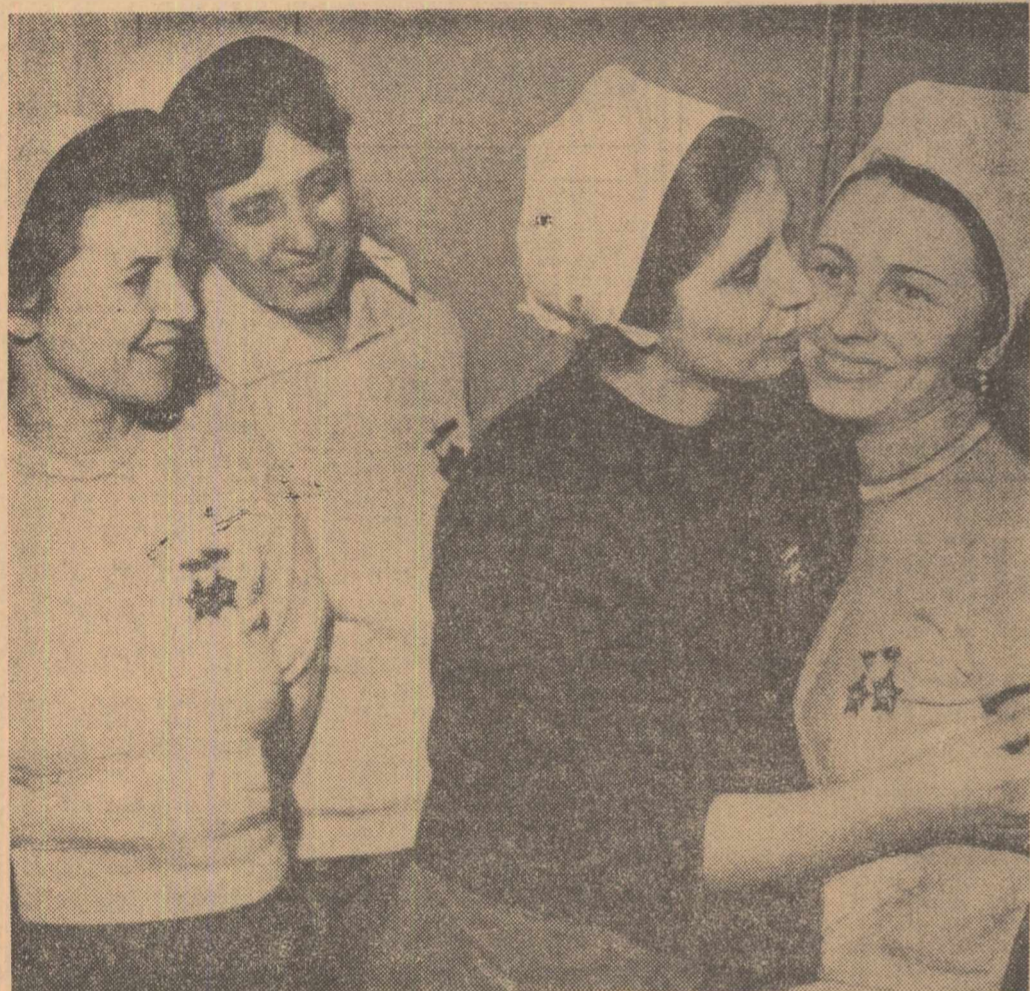
Moment de bucurie firească la Filatura de bumbac — București

În Editura politică a apărut Nicolae Ceaușescu: „CUVÎNTARE LA CONSĂTĂUIREA CONSACRATĂ ACTIVITĂȚII DE PROIECTARE ÎN DOMENIUL CONSTRUCȚIILOR” — 27 ianuarie 1967 —