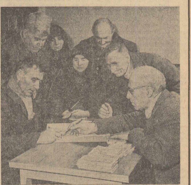
O imagine frecventă în aceste zile în satele patriei: plata pensiilor țăranilor cooperatori.