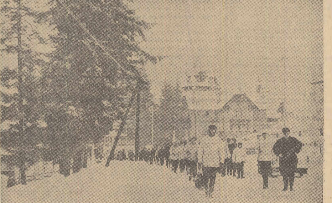
În drum spre Cota 1400