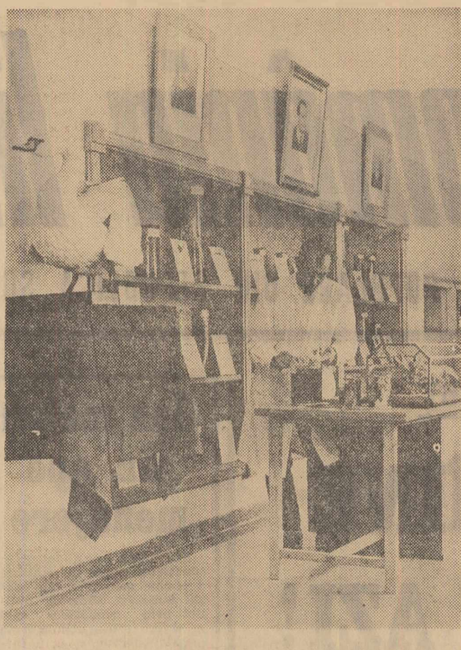
Stațiunea zoologică marină de la Agigea, care poartă numele fondatorului ei — prof. Ioan Boresca — a intrat în cel de-al V-lea deceniu de activitate. Aici se desfășoară importante cercetări privind studiul apelor românești, stațiunea dispunând în acest scop de laboratoare moderne. În clișeu: aspect din muzeul stațiunii, care este completat cu noi exponate