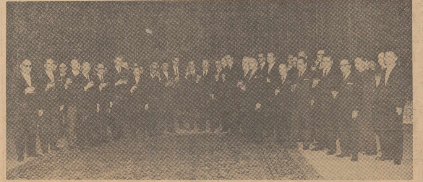
În timpul primirii la Consiliul de Stat