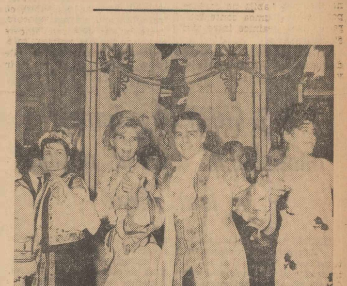
La Carnavalul de la Palatul Republicii: tineri îmbrăcați în costume naționale, alături de alții transformați ad-hoc în personaje de basm, incing hore aprige

lui descrețește frunțile a mil și mil de oameni și-a deschis în clipele acestea o proprie și modestă paranteză festivă. — Să vedeți — ne spune artistul emerit Mircea Crișan — peste tot unde mă duc sînt invitat să spun o glumă. Doar atît. Parafrazînd zicala: „Omul propune, iar comiicul dispune”. — Adică dispune lumea. — Bineînțeleas. — Ce-ți dorești pentru 1967. — Ca băiatul meu să crească mare și sănătos și bineînțeleas, îmi doresc multe succese. Nici n-a terminat bine ultimele cuvinte și... a și dispărut spre numeroasele spectacole unde este așteptat. Noroc că și-a terminat sandvișul.