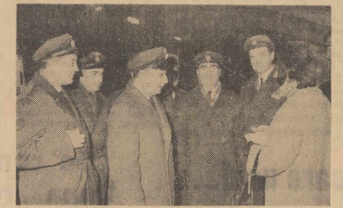
Echipajul de pe IL 18 — întors din călătoria de peste ocean a sîns în București înainte de sosirea „înaripată” a anului nou

Nerăbdători să ajungă lîngă ai lor aviatorii echipajului întors din Havana au luat trenul accelerat care pleca de la Constanța mai înainte. Timp de bilet sau tichet nu mai era, evident. Dar mai încapere vreun fel de reproș într-o asemenea împrejurare? Haideti să recontăm cum nu! Comandantul aeronavei a făcut un schimb de experiență (neplanificat!) cu mecanicul de locomotivă, recunoscînd că nu doar în aer se navighează greu pe ceață, ci și pe drumurile de fier. Cum necum, fapt este că echipajul avionului a sosit pe peronul Gării de Nord cu citeva ceasuri înainte de noul an, nefînd așteptați la ora aceea de nimeni: surpriza a fost însă cu ațit mai mare!