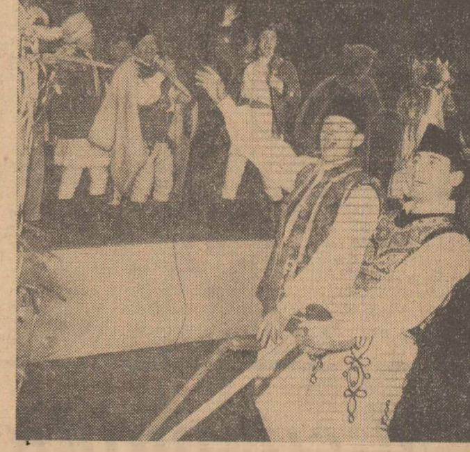
Simbol al belșugului și fertilității, plugul gata să răstoarne brazda grasă...

Cinci reporteri, trei înarmați cu condei și carnetul, doi cu aparatul de fotografiat, ne aflăm, în ajunul anului nou, gata să începem colindul, în căutare de fapte, gînduri, impresii, pentru acest reportaj. Am fi dorit să avem ubiuitatea bătrînelui Moș Gerilă, a anului ce sta să vină, să putem fi de față în toate căminele, în toate colturile țării, unde, trînd împreună cu gazele mulțumirea și veselia acestor clipe, ni s-ar fi reînnoit și prilejul cunoașterii acelor lucruri minunate ce se înfăptuiesc în țara noastră din îndemnul și sub îndrumarea comunistilor. Ceea ce am văzut pe unde am