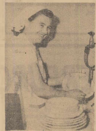
Tot mama, spală vasele... pentru cei mici. Ciocnesc și ei în joacă. Trăim un sentiment tonic de robustețe și optimism!

menile de activitate, primește cu bucurie în inimă urarea că anul ce vine să aducă noi biruinți în fărîngirea patriei socialiste. Ciocnim cu tata un pahar de vin. Lîngă paharele cu vin s-au orînduit paharele cu lapte,