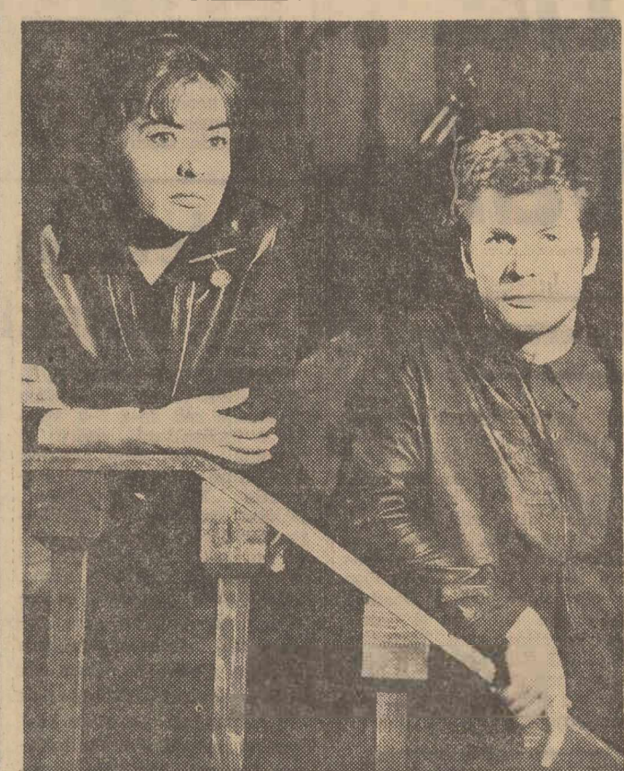
Pe scena Teatrului din Ploiești s-a prezentat zilele trecute în premieră piesa „Neîncredere în foisor” de N. Ionescu. În cîntecul un moment din spectacol.

Astăzi și mâine are loc în sala Teatrului Uniunii Generale a Sindicatelor o consfătuire pe țară cu instructorii forma- ților coregrafice de amatori de la orașe și sate. După un referat analitic se vor prezenta un număr de dansuri interpre- tate de formații din cîteva re- giuni. Duminică vor avea loc discuții pe marginea referatului și spectacolului dat cu o zi mai înainte.