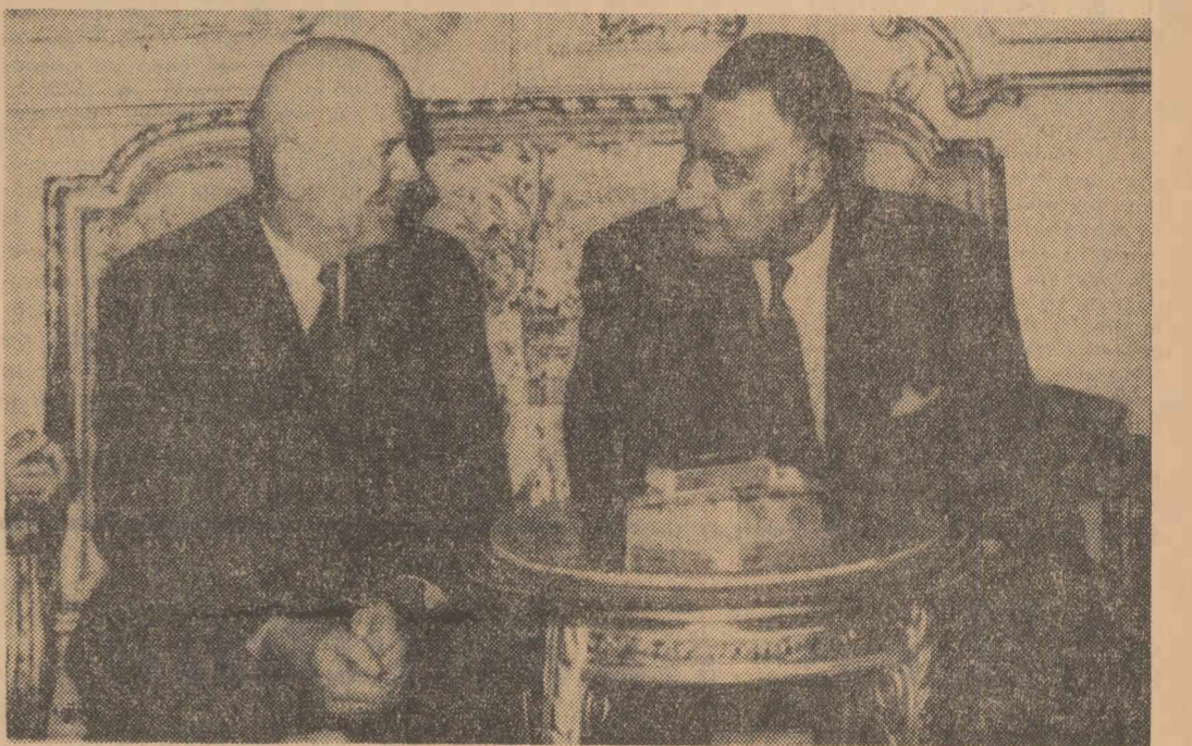
În timpul vizitei protocolare la președintele Nasser