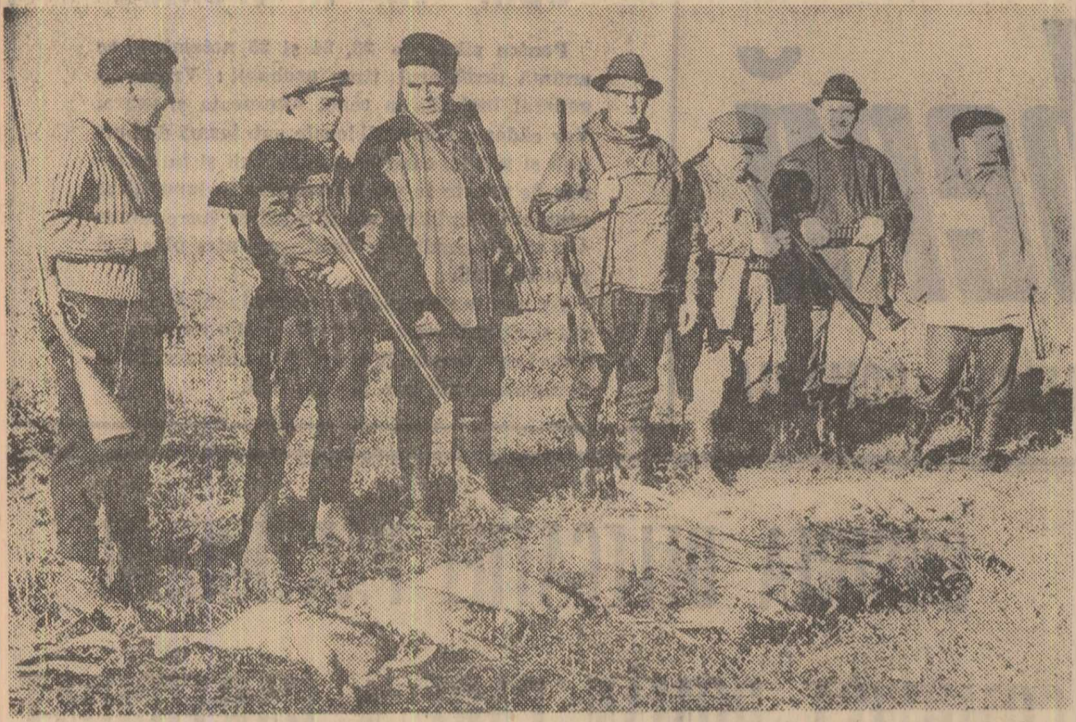
Ieri a început sezonul de vânătoare la iepuri și fazani. În clișeu: Vânătorii ai filialei raionale 30 Decembrie din Capitală după închiderea unei „bătăi”