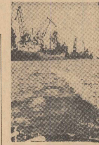
Aspect din portul Riga

port, s-a ridicat un centru de conservare prin afumare a peștelui, precum și baza de expediere rapidă a celui proaspăt în oraș. În acest