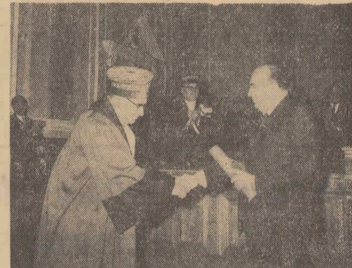
Momentul conferirii titlului de Doctor Honoris Causa premierului Hoveida

Seara, primul ministru al Iranului și persoanele care îl însoțesc au plecat cu trenul special spre București.