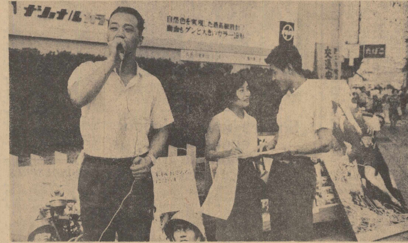
Fotografii ale Lunei transmise de stația „Luna-12”

„După ce pacea va fi restabilită, poporul vietnamez și va consacra forța și inteligența reconstruirii patriei sale, democratică și prosperă, care să aibă relații prietenești cu toate popoarele pașnice din lume” — a încheiat președintele R. D. Vietnam.