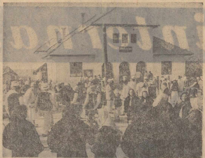
Duminică, la căminul cultural din Birsana, pe Valea Izel, începerea programului și totdeauna așteptată cu nerăbdare.