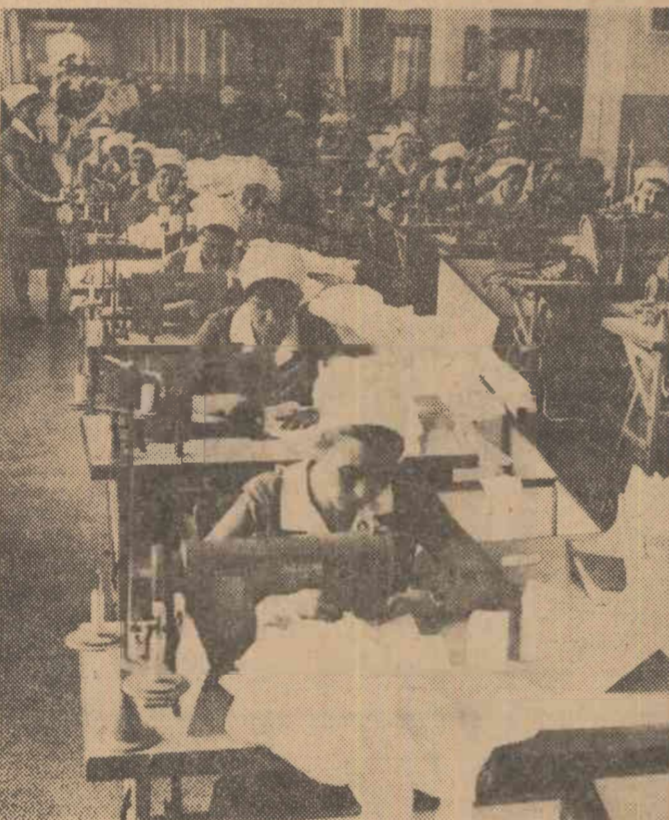
Recent la Fabrica de confecții și tricotate București a intrat în producție o nouă bandă de lucru, cu o capacitate de 25.000 cămăși bărbătești și copii, confecționate din poplin, zefir și alte materiale. În clișeu: aspect parțial al noii benzi de lucru

Anul acesta industria noastră constructoare de mașini va realiza aproximativ 8.500 mașini unelte pentru aschiere metalelor, printre care strunguri carusel, normale și revolver, mașini de rectificat, de frezat, prese etc. Concomitent cu extinderea producției la sortimentele a-mintite se vor produce varietate noi de astfel de mașini, cu randamente sporite și cu posibilități de adaptare în prelucrarea unei game largi de piese pentru diferite mașini. Un loc tot mai important în producția de mașini unelte în țara noastră îl vor ocupa mașinile specializate, mașinile unelte-agregate, ale căror performanțe superioare se ridică la nivelul tehnicii mondiale. (Agerpres).