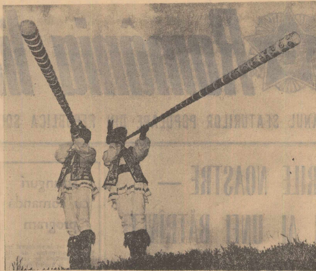
În zilele de sărbătoare, peste creștele munților Apuseni răsună glasul tunicelor