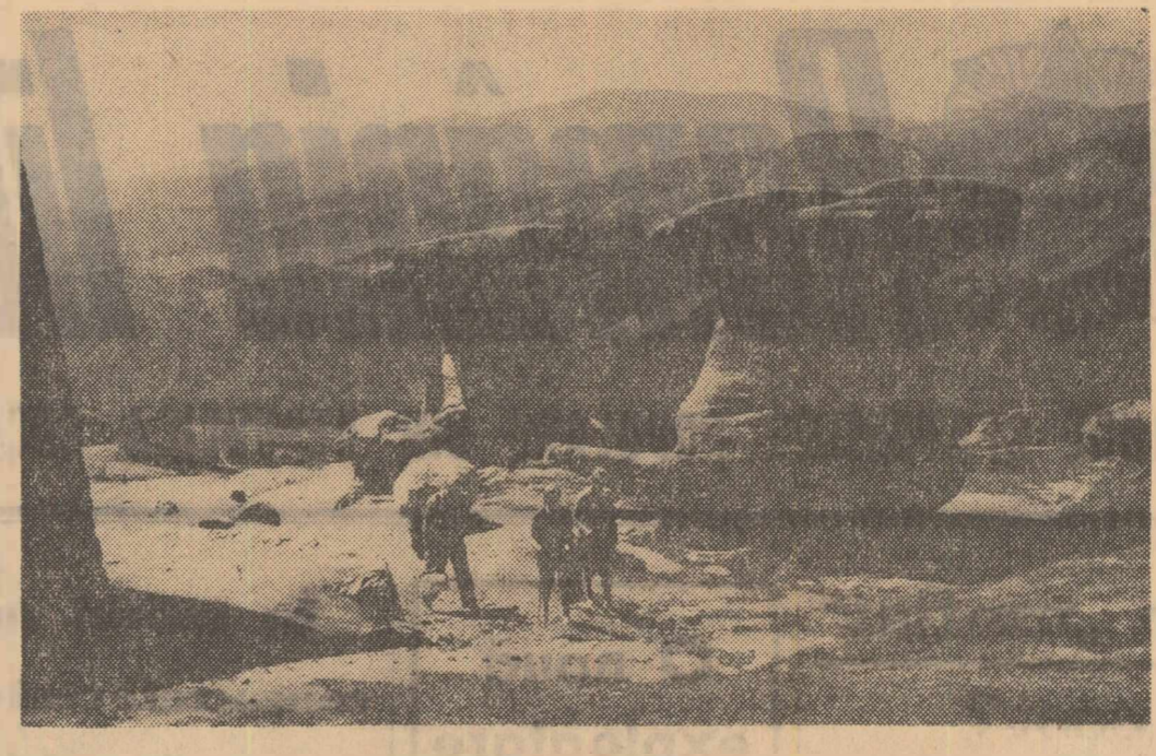
MUNȚII BUCEGI: Vedere de pe Babele Mari