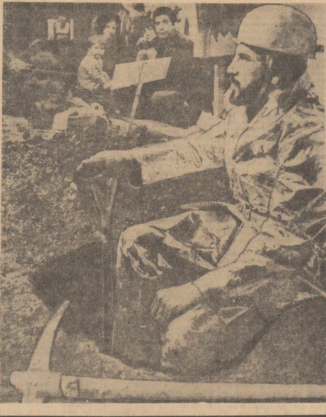
Corespondență din New York de la Anthony Ray

În aceste condiții, cum se remarcă în capitalele africane, discuțiile din sala parlamentului nigerian nu vor fi lipsite de asperități. Adepții vechilor forme tribale își vor apăra cu tenacitate punctul lor de vedere față de partizanii unității țării.