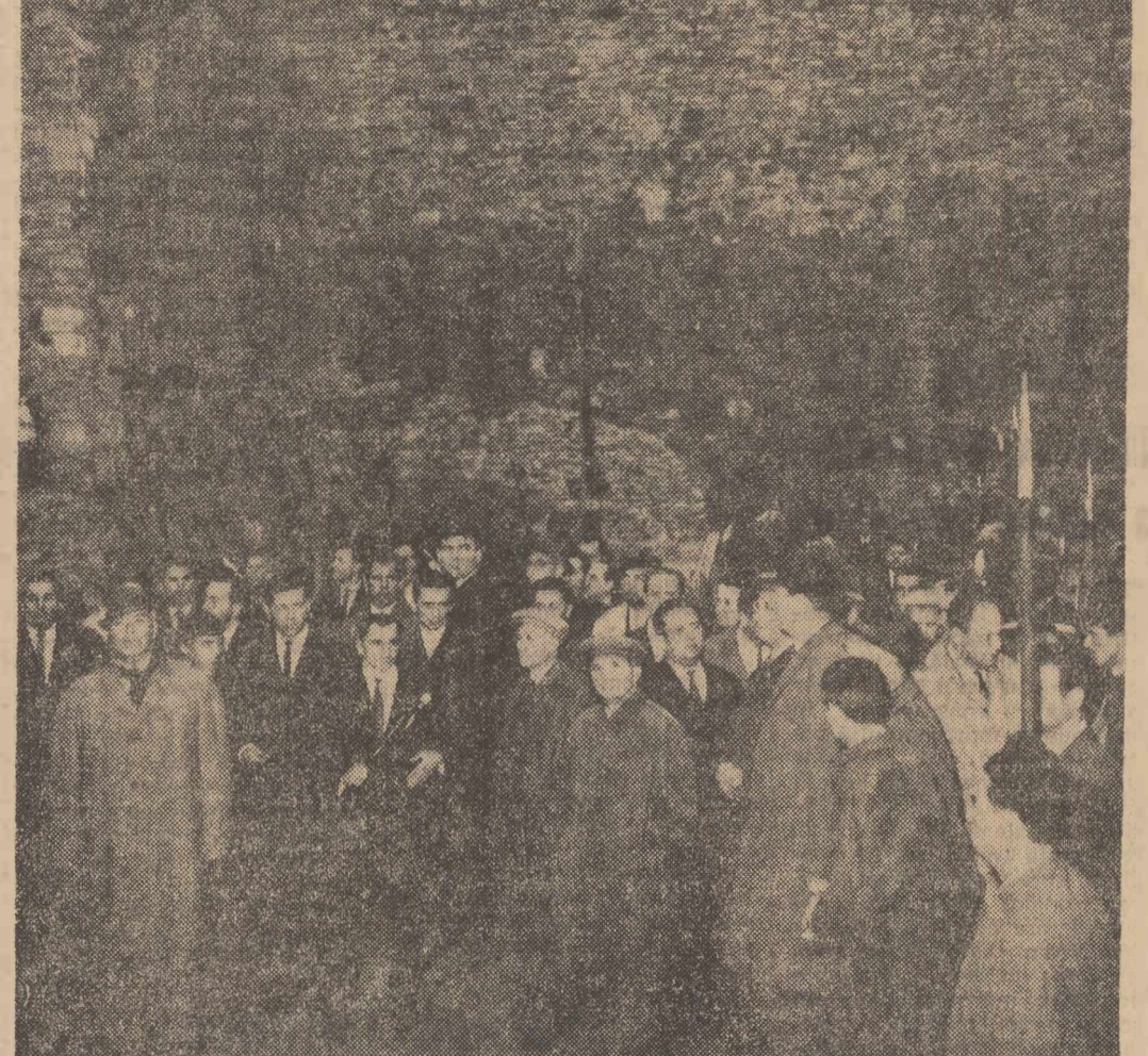
In vizită la Cetatea Neamțului

Orășul dv. este un oraș străvechi. Pe aici a trăit și a dus bătaia Ștefan cel Mare — și cunoașteți ce rol important au avut luptele pe care le-a purtat în acele vremuri vitrege, pentru apărarea independenței Moldovei și, prin aceasta, a neatrării poporului român. Desigur că aceste momente de mare însemnătate ale istoriei noastre merită să fie — și ele sînt — cinstite de întregul popor, stîrnind totodată admirația vizitatorilor care înțeleg pe aceste meleaguri mărturiile străduințelor poporului român de a-și înălța continuu patria, din veac în veac, spre o viață din ce în ce mai bună. Prețuind trecutul de luptă pentru neatrarea patriei, cinstind lupta de eliberare națională și socială a poporului, lupta mișcării muncitorești și a partidului comunist, a tuturor patrioților care s-au ridicat pentru libertatea patriei, aducem prinoul nostru de recunoștință tuturor acelor care, într-un fel sau altul, au contribuit la fărîșirea statului român, la cucerirea puterii politice de către oamenii muncii. Această cinstire o facem nu numai prin cuvinte, ci, în mod deosebit, prin muncă neprecupețită pentru creșterea continuă a bunăstării patriei. Și tot ceea ce am înfrupt în anii construcției socialiste — dezvoltarea industriei, agriculturii, științei, culturii — este chemat să asigure progresul continuu al națiunii noastre, înflorirea neîntreruptă a României socialiste!