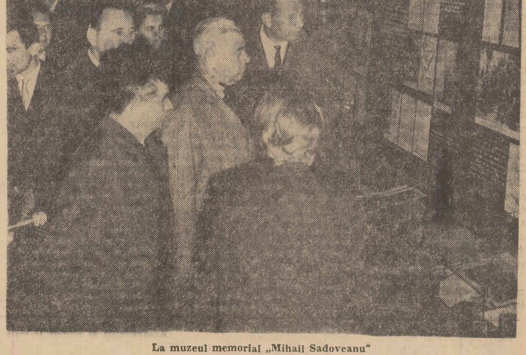
La muzeul memorial „Mihail Sadoveanu”

conducerii noastre de stat, ca și multe alte monumente legate de trecutul istoric al poporului nostru, Mănăstirea Neamț se înalță astăzi în fața dv. în haina nouă, păstrînd în ea cu sîntenie importantă valori de ordin artistic și istoric, fiind o mărturie vie și o expresie a geniului creator al poporului român. Vă întîmpin din toată inima cu tradiționala urare „Bine ați venit!”, poftindu-vă totodată a vizita acest important monument istoric. Oaspeții se opresc mai întîi la străvechile temelii puse în vremea lui Petru Musat, în secolul XIV, și trecînd apoi la edificiul ctitorit de Ștefan Voievod, în 1497. Vastele lucrări de restaurare întreprinse în anii noștri, cu sprijinul