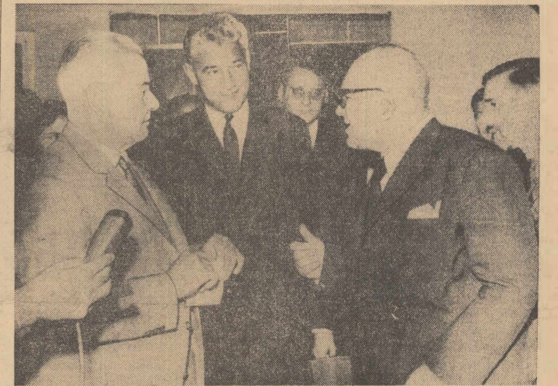
La sosire, pe aeroportul din Atena