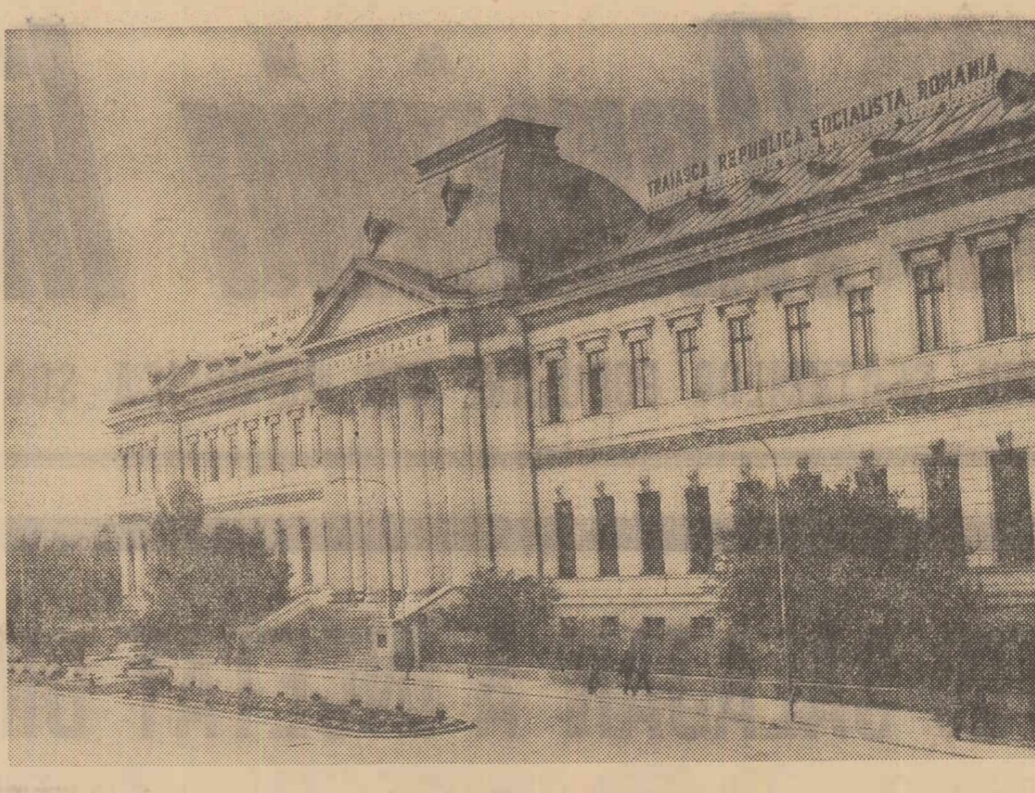
Localul Universității din Craiova

grăsiminte organo-minerale în mod diferențiat, în raport cu vârsta și starea plantajului. Rezultatele obținute în experiențele cu țării aplicate la pomii au demonstrat că aceste operații trebuie executate în mod diferențiat de la pom la pom. La pomii tineri trebuie să se insiste mai mult asupra tăierilor de formare, adoptându-se forma netajată cu 6-7 ramuri în coroană, sau piramida mixtă cu 6-7 ramuri în coroană. La pomii întrași pe rod trebuie aplicate mai mult tăieri de rărire atita timp cât ei nu manifestă semne de îmbătrânire, iar după aceea tăieri de reținere parțială.