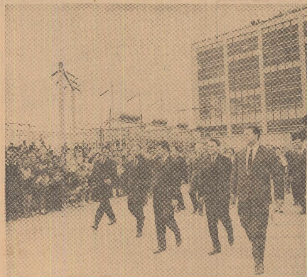
La Termocentrala Luduș

onale — depășirea se ridică la 10.000 de tone, cantitate cu care se pot combate dăunătorii de pe o suprafață de cca 50.000 ha de culturi agricole și păduri. Aceste importante depășiri sînt rodul intenselor preocupări a întregului colectiv al combinatului pentru folosirea deplină a capacității instalațiilor. (Agerpres).