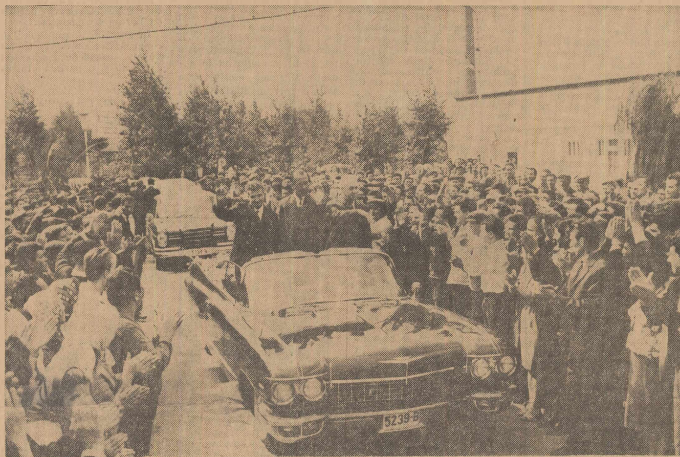
Conducătorii de partid și de stat au fost întîmpinați cu dragoste și căldură

De atunci sînt aproape 20 de ani. Am realizat multe. Brigadierii de la Agnita-Botorca sînt astăzi oameni în vîrstă, unii dintre ei au copii care lucrează pe noi șantiere. Ei au devenit buni meseriași în diferite domenii de activitate, unii sînt ingineri, profesori sau doctori și, împreună cu toți oamenii muncii, contribuie la făurirea vieții luminoase pentru întregul nostru popor. Permiteți-mi să vă transmit un salut călduros din partea Comitetului nostru Central și să vă spun — după cum se obișnuiește la noi — bine v-am găsit. Vă doresc multă sănătate, noi succese în viață și activitatea dv. Iar fostișii brigadieri — a spus secretarul general al C.C. al P.C.R. — le doresc ca în ac-