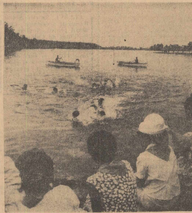
Aspect din tabăra de pionieri și școlari de la Snagov