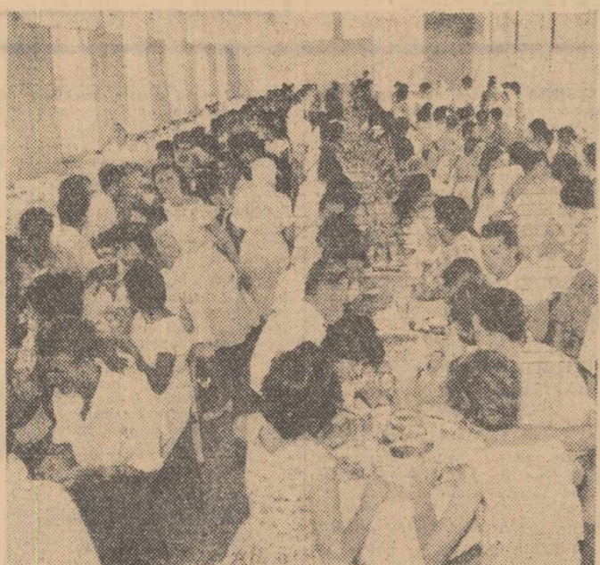
Ora mesei la Costinești