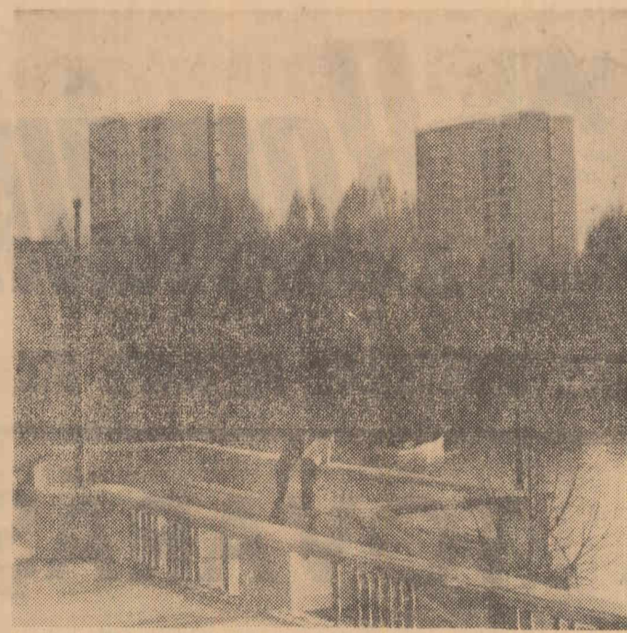
Aspect din parcul „23 August”

Vineri s-au încheiat lucrările ședinței plene a Consiliului Național al Cercetării Științifice. Planul a adoptat în unanimitate Programul unitar al cercetării științifice pe perioada 1966—1970. La cel de-al doilea punct de pe ordinea de zi, conf. univ. Traian Dudaș, secretar general al Consiliului Național al Cercetării Științifice, a prezentat planul de măsuri privind participarea Consiliului Național al Cercetării Științifice, a oamenilor de știință și cercetătorilor științifici la acțiunile de lansare a planului de stat pe perioada 1966—1970. În concluziile planului a luat cuvîntul tovarășul Roman Moldovan, vicepreședintele al Consiliului de Miniștri, președintele Consiliului Național al Cercetării Științifice. (Agerpres)