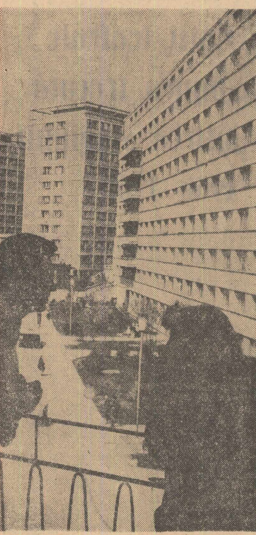
In cartierul Horia din Iași s-au ridicat noi blocuri de locuințe