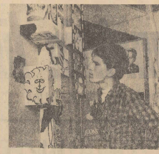
Cu prilejul Festivalului filmului de animație s-a amenajat o expoziție în holul hotelului „Perla” din Mamaia. Înălțur: Primul vizitator al expoziției, actorul Dan Nuțu.