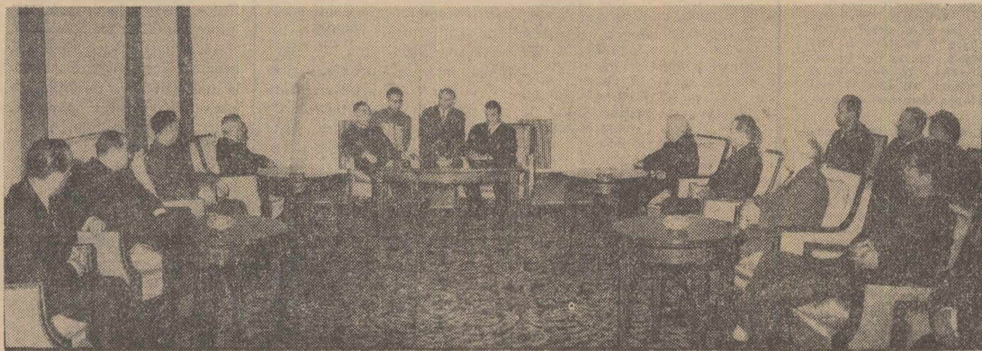
La C.C. al P.C.R. în timpul vizitei făcute conducerii de partid și de stat