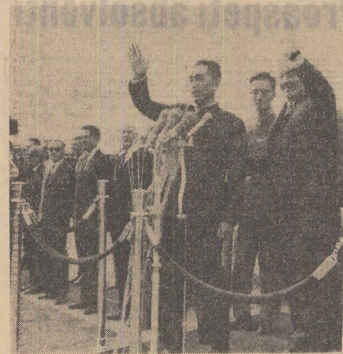
La sosire, pe aeroportul Băneasa

soldați guvernamentali au trecut de partea populației rebelе. Postul de radio clandestin din Hue cheamă în continuare soldații primei divizii saigoneze să treacă de partea dizidenților. În urma acestei situații deosebit de grave, generalul Nhuon, comandantul primei divizii, a adresat apeluri repetate, cu caracter ultimativ, soldaților care s-au alăturat populației din Hue pentru a se prezenta imediat la unitățile lor.