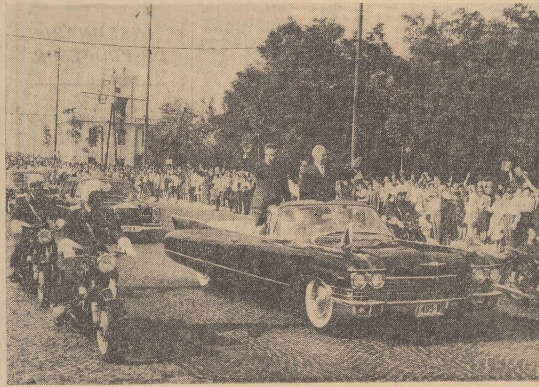
Cetățenii Capitalei salută pe înalții oaspeți.

Această vizită va constitui un nou prilej de manifestare a prieteniei și colaborării tovarășești dintre partidele și popoarele noastre, bazate pe comunismul ideologic marxist-leninist, a orînduirilor sociale din cele două țări, pe