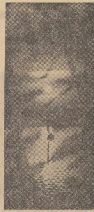
Clar de lună pe lacul Săgheoia.

Ședința Consiliilor reunite a fost prezidată de către tovarășul acad. Ștefan Bălan, ministrul Învățământului. La ședință a luat parte tovarășul Leonte Răutu, membru al Comitetului Executiv și secretar al Comitetului Central al Partidului Comunist Român. (Agerpres).