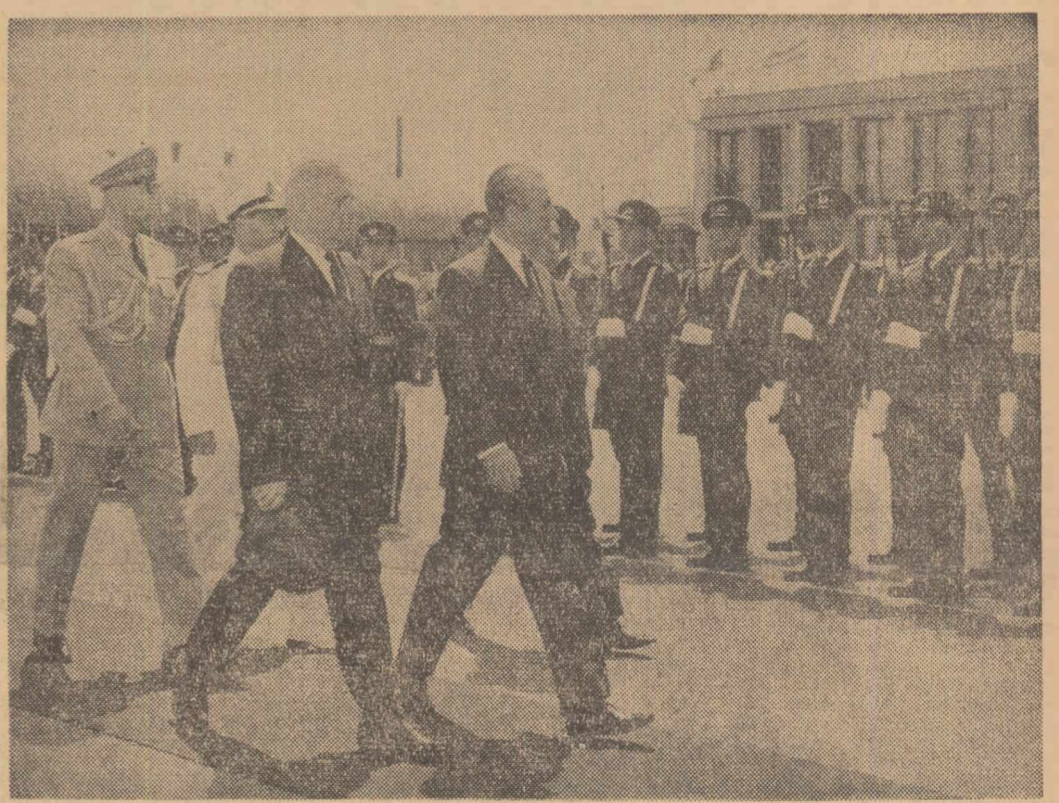
La sosire pe Aeroportul Băneasa

În întâmpinarea Maiestății Sale Imperiale, pe aeroportul Băneasa se aflau președintele Consiliului de Stat al Republicii Socialiste România, Ion Gheorghe Maurer, și alți excelenți ai țării noastre.