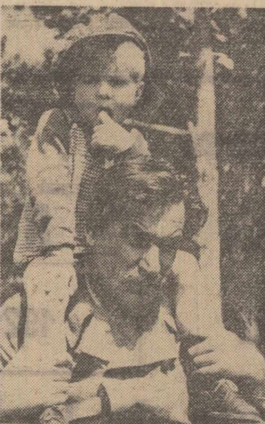
Scenariu: Ivan Ribic; Regia: France Stiglic; Imagini: Ivan Marinček; Căsuțe: Ljiljana Rozman, Bert Sotlar, Zlatko Sugman, Majda Potokareva, Bogdan Lubej.

Film distins la Festivalul de la Pola cu: „Arena de aur” pentru scenariu și regie și „Arena de argint” pentru partitură muzicală.