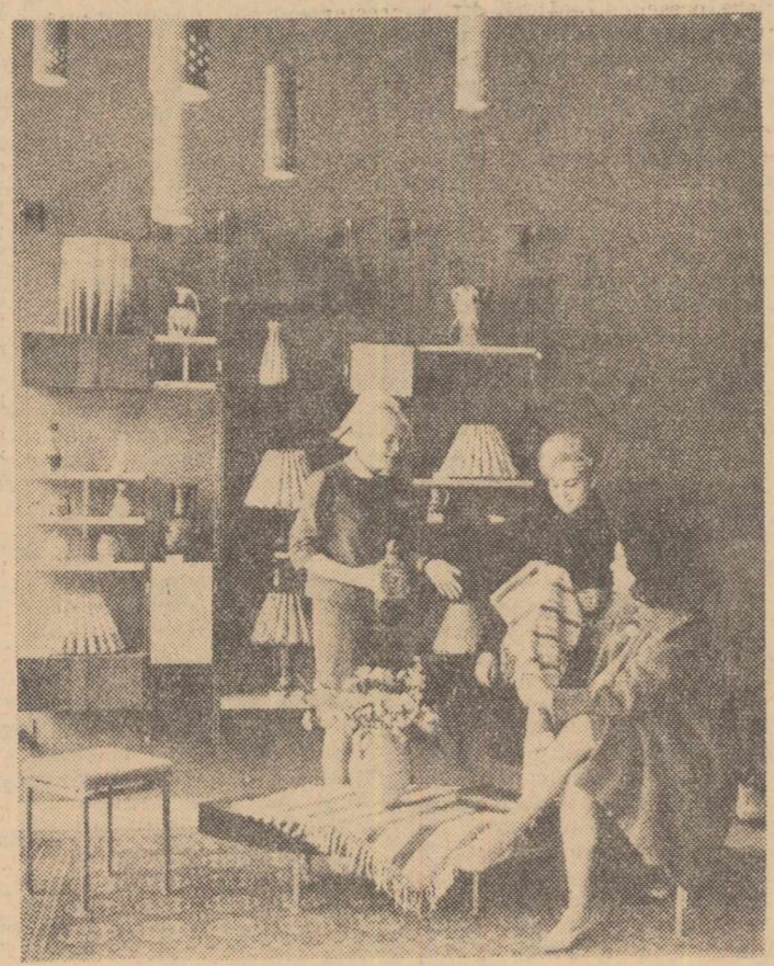
Modernul magazin de artizanat din Capitală, de pe Șoseaua Ștefan cel Mare — lângă cinematograful „Melodia” — este aprovizionat cu un bogat sortiment de mărfuri de specialitate. Alenta și compența servirea a cumpărătorilor fac ca acest magazin să fie solicitat de public. În clișeu: un aspect din magazin

Specialiștii întreprinderii „Chimica” au obținut un nou produs pînă acum importat. Este vorba despre sideful sintetic anorganic. Spre deosebire de guanina organică — denumire sub care mai este cunoscut sideful — produsul sintetic realizat are o mai mare rezistență la temperatura de prelucrare și pătrunde în profunzimea materialelor care sînt placate cu această substanță de mare efect estetic. Noul produs a și fost utilizat cu succes la sidefarea plăcilor de masă plastică. (Agerpres).