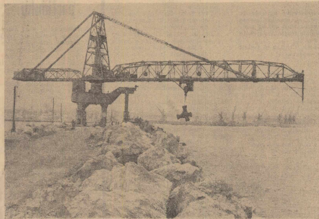
Portul Constanța se modernizează. Constructorii vor dura diguri pe o lungime totală de peste 2 500 de metri, asigurînd un bazin corespunzător traficului din ce în ce mai mare, pe care-l cunoaște portul nostru maritim. Pînă în prezent au fost efectuate diguri pe o lungime de 910 metri. În clișeu: cu ajutorul macaralei gigant, peste blocurile naturale ale digului se lansează prefabricate de beton în greutate de 20 tone fiecare