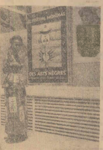
Fotografia prezintă una din gazdele festivalului, purtînd o rochie imprimată care reproduce afișul oficial al acestor mari manifestații culturale, fotografiate în fața afișului festivalului

DAKAR 8 (Agerpres). — După încheierea Colocviului internațional de la Dakar, ce s-a desfășurat cu ocazia primului Festival mondial de artă neagră, au fost acordate primele premii în domeniul literaturii, picturii, cinematografului etc. Premiul literar pentru cel mai bun roman a fost decernat de către juriul nigerianului James Ngugi, autorul lucrării „Nu plînge”. „Nu-i ușor să ajungi la libertate” se intitulă raportul lui Nelson Mandela din Africa de Sud, care a primit o distincție din partea juriului. Marele premiu pentru pictură a fost acordat lui Franck Bowling (Guyana Britanică). Premiul „Antilopa de argint” a acordat pentru cel mai bun film de lung metraj a fost obținut de Usmane Sembene din Senegal. Filmul de artă neagră „Oamenii dansului”, realizat de către Diagne Costa din Guineea, a fost premiat cu „Antilopa de aur”.