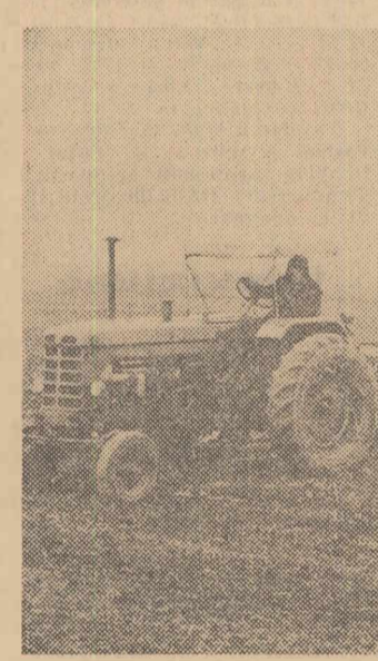
La gospodăria de stat din Alexandria se însămînțează lucerna pe ultimele suprafețe.

Există o vreme cînd toate aceste adevăruri erau subversive, cînd pentru cea mai mică înclinație de a le aproba, oamenii inimoși, curajoși și inteligenți, erau excomunicăți, torturați, înjunghiați, arși pe rug.