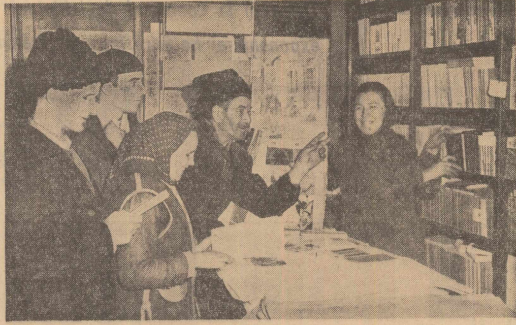
Aspect de la cooperativa din comuna Bucovăț, regiunea Craiova. Mulți solicitanți în fața raionului de cărți