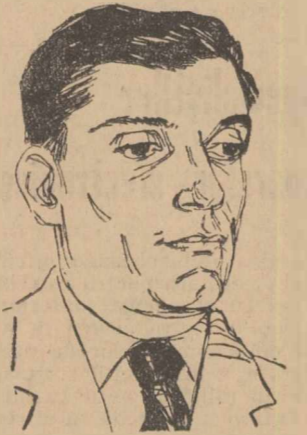
deprînda și „după carte” știința creșterii și îngrijirii vitelor. Sub îngrijirea lui