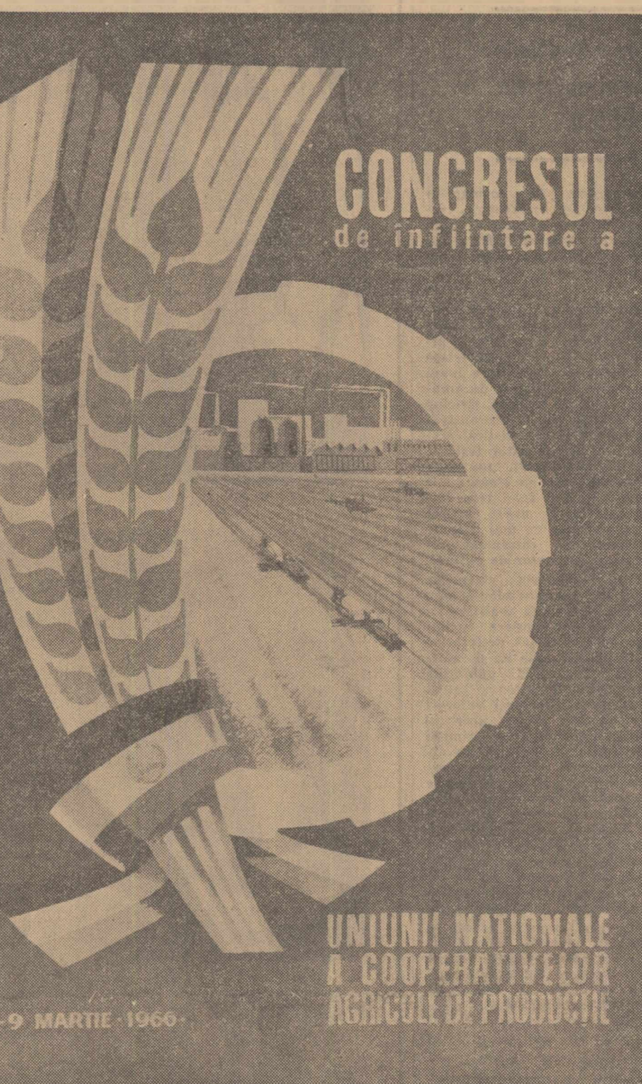
In zilele de 7-9 martie, Capitala patriei noastre va găzdui Congresul de înființare a Uniunii Naționale a Cooperativelor Agricole de Producție. În pagina a 3-a — „PE CALEA ÎNFLORIRII CONTINUE A AGRICULTURII COOPERATISTE” — vă prezentăm delegații la acest congres.

după care Herman Henry a fost trimis în judecată pentru „afectare la crimă”. O fi nebun? Poate. Dar autoritățile americane îl consideră, peșemne, responsabil pentru că altfel nu l-ar fi trimis în fața unui tribunal, ci într-un ospiciu. În acest caz, de unde să-l fi venit ideea? Nu cumva din unele practici oficializate? Să ne întrebăm. Nimeni nu poate acuza Washingtonul că a în-