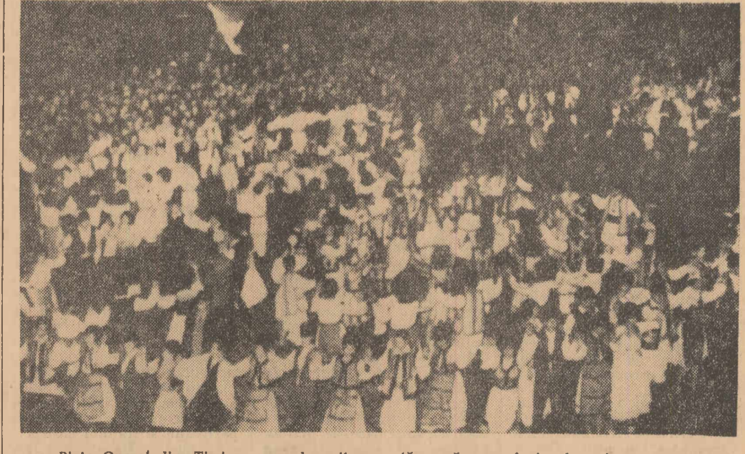
Piața Operelor din Timișoara a devenit o vastă scenă: s-au încins hore în care s-au prins locuitorii orașului și sătenii din satele învecinate veniți să salute pe conducătorii de partid și de stat

PITEȘTI — La Combinatul de industrializare a lemnului din Rîmnicu Vilcea au fost realizate două noi sortimente din lemn densificat. Lignofolul care are o mare rezistență la frezare — de 3 ori mai mare decît fonta — și-a găsit întîlnire la locomotivele Diesel electrice, și în industria textilă, unde înlocuiește o serie de piese din metal și ba-chelită. În ceea ce privește lignostolul, ancorele realizate din acest material au un preț de cost de aproape 5 ori mai mic decît al celor din beton armat pe care le înlocuiesc. Ele prezintă, totodată caracteristici fizico-mecanice superioare. (Agerpres).