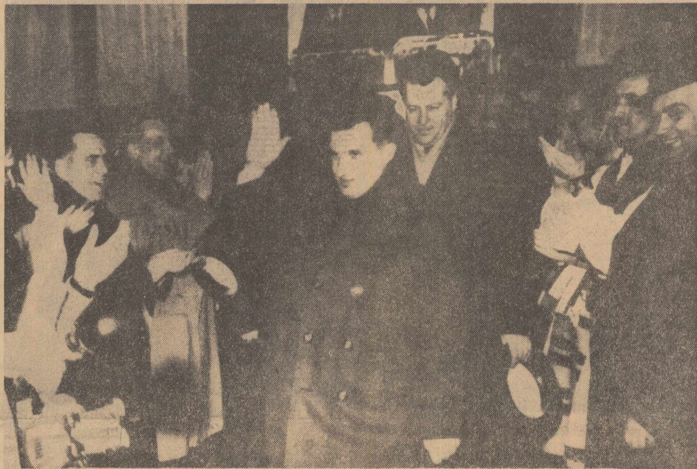
O mulțime entuziasată a înconjurat pe conducătorii de partid și de stat din primul clipse ale sosirii

Delegații au arătat, în cuvântul lor, că uniunile cooperatiste au obligația — așa cum prevede proiectul de statut — să contribuie, de la începutul activității lor, la coordonarea și intensificarea eforturilor pentru înflorirea agriculturii cooperatiste, pentru ridicarea nivelului de trai material și cultural al oamenilor muncii de la sate, pentru sporirea aportului țărănimii la avântul întregii economii naționale, la creșterea bunăstării populului. În planurile de măsuri adoptate și a căror traducere în viață va duce la sporirea continuă a producției agricole și la întărirea economic-organizatorică a unităților, s-a prevăzut