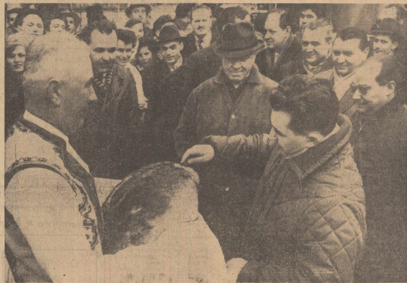
Cooperatorii din Salonta urează oaspeților bun sosit.