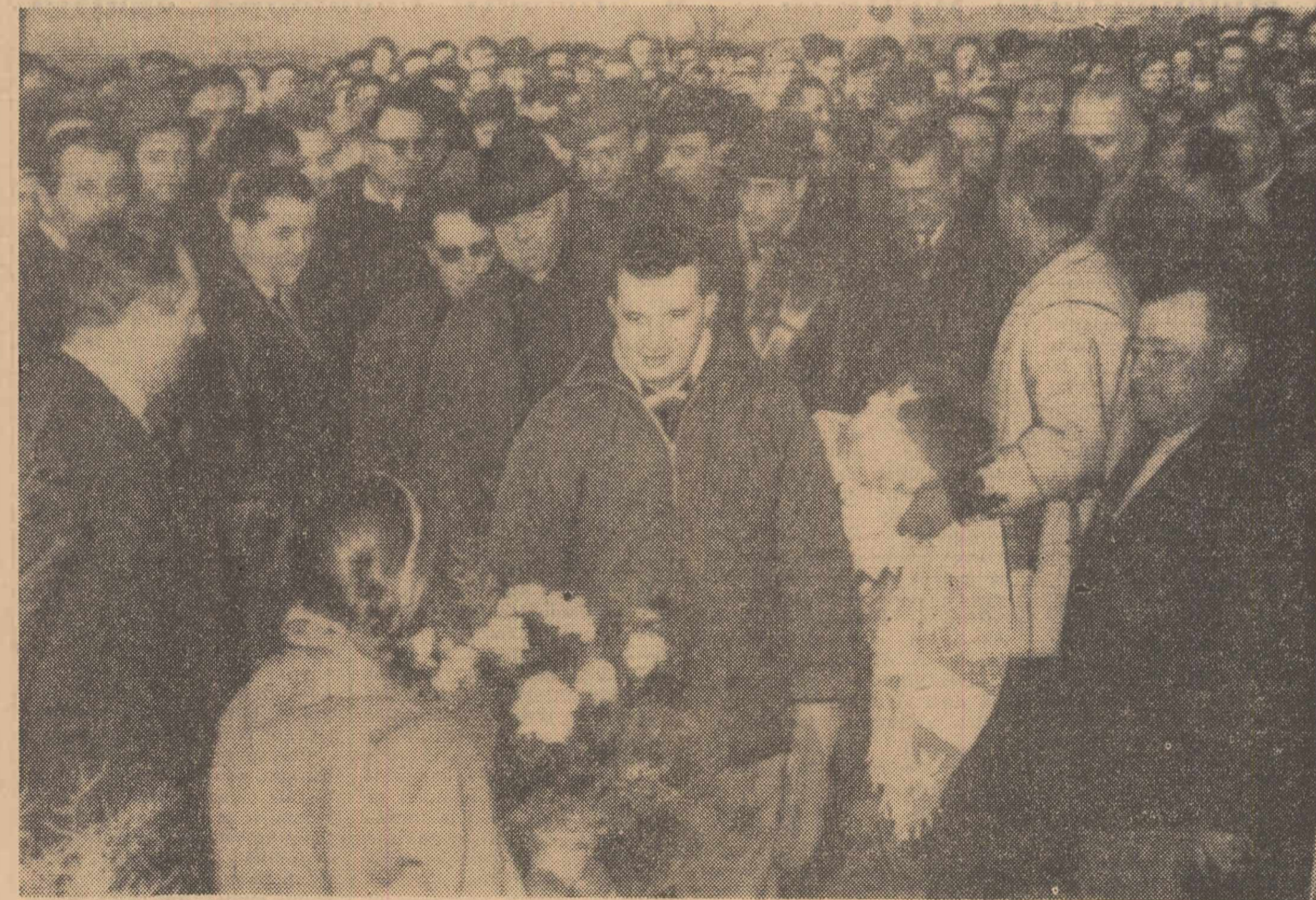
Conducătorii de partid și de stat primiți cu multă căldură de către cooperatorii din Sintana.