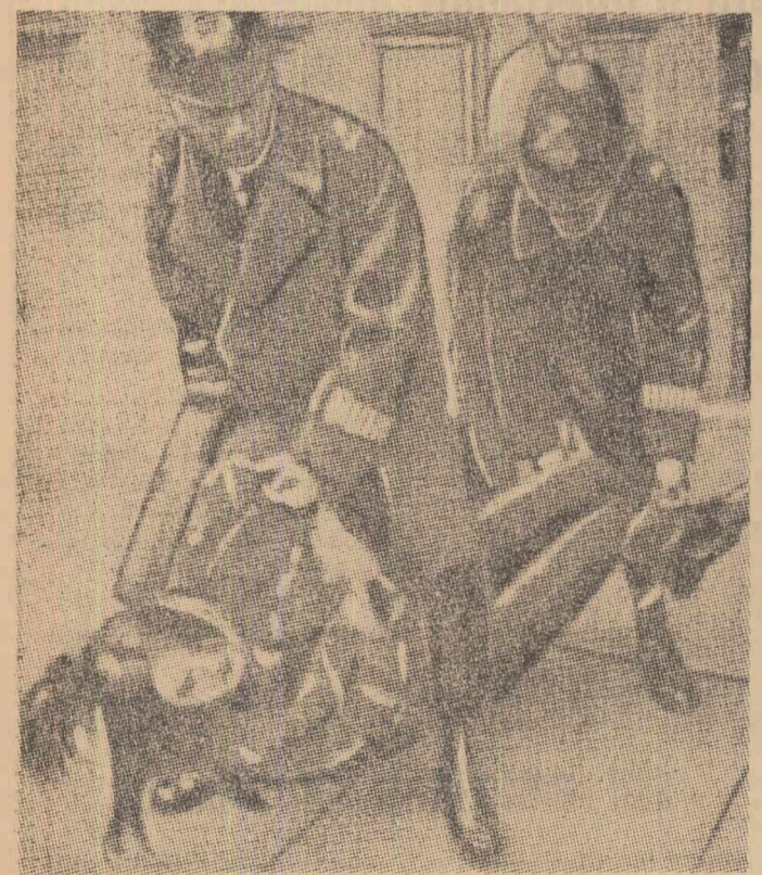
Linistea Camerei Comunelor, bine păzită de poliție, a fost tulburată de demonstrația unor tineri londonezi, împotriva agresiunii americane din Vietnam. Precum se vede în imaginea de mai sus polițiștii „parlamentari” au reacționat cu mijloace ne-parlamentare...

Pe de altă parte, arată observatorii, dacă scăderea exporturilor s-ar putea explica, creșterea importurilor a devenit cel puțin „neliniștitoare”. Acestea continuă să crească cu mai mult de 2 la sută (media trimestrială), în vreme ce autoritățile așteptau ca supra-taxele vamale și restricțiile interne să determine „o plafonare, dacă nu o regresivitate” a importurilor.