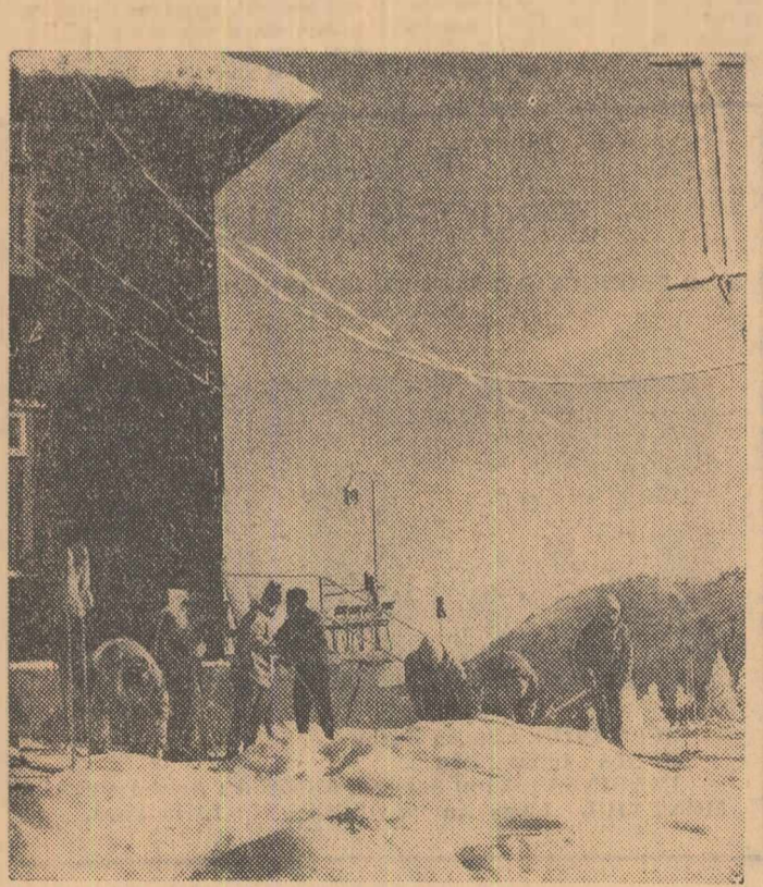
Valea Prahovel, a Timșului, a Olului, Polana Brasov și Postăvului, Semenul etc. au primit simbatic și duminică numeroși oaspeți așteptați la cabane, hoteluri și restaurante. În cîșeu: Aspect de la cabana Cristian din munții Postăvului